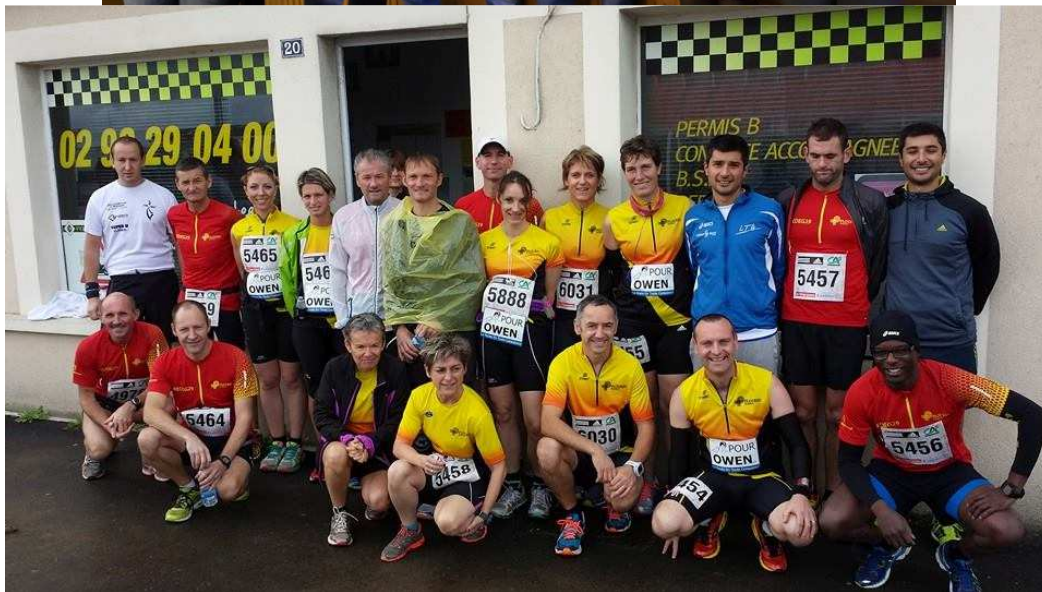
Une partie du club au Saint-Pol- Morlaix 2014