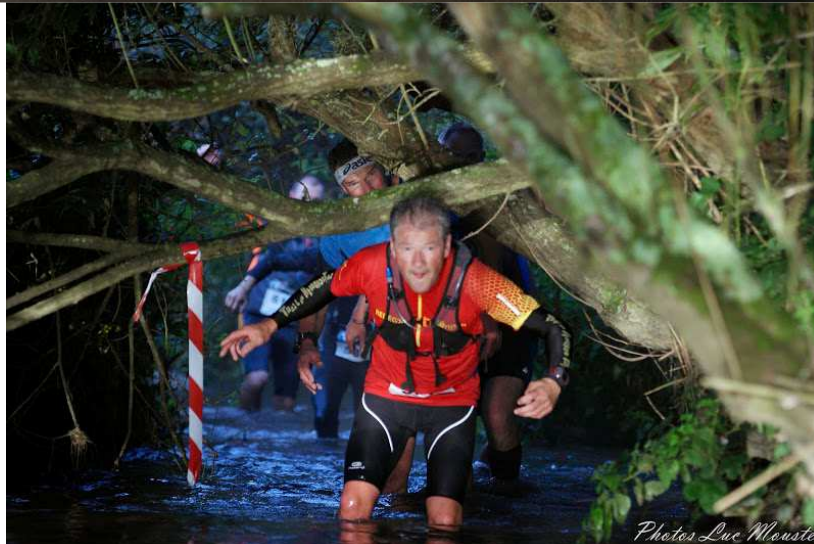
Trail de la Baie du Kernic