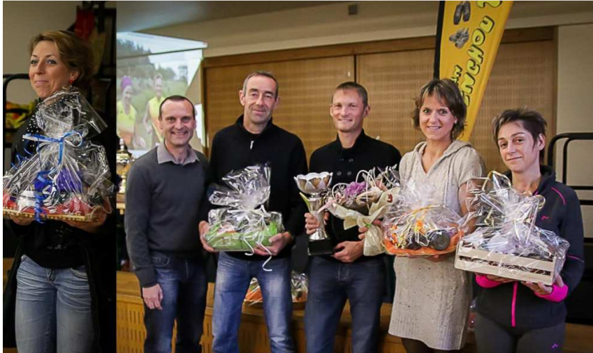
Challenge Interne 2013-2014